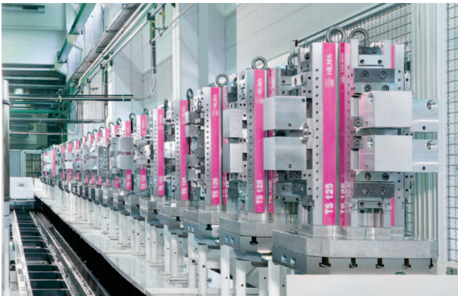
Die Spezialität der Hilma-Roemheld GmbH sind Mehrfach- und Turmspannsysteme, auf denen mehrere Schraubstöcke montiert sind. Mit ihnen lässt sich die Zahl der Werkstückwechsel deutlich verringern.